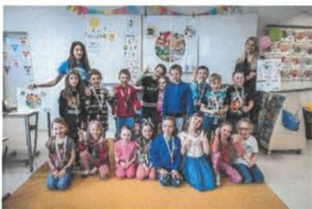
Zdravá 5 ve škole

6.7. Nadační fond Albert každý rok rozdělí na podporu a pomoc výše zmíněných projektů nemalé finanční prostředky. Od roku 2019 více než zčtyřnásobil své dary na hodnotu téměř 18 milionů korun a navýšil počet podpořených organizací.