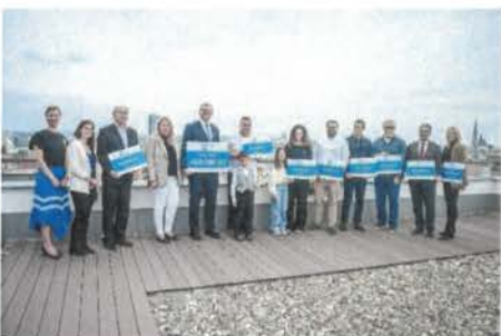
Předávání šeků dětským domovům